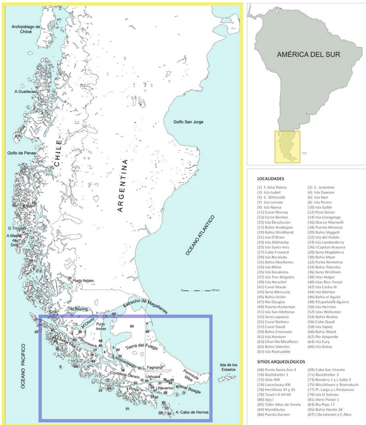
Fig. 1 Localización de Fuego-Patagonia y área de estudio. Recuadro amarillo: Patagonia y Tierra del Fuego. Recuadro azul: archipiélago fueguino. Ver ubicación completa de localidades y sitios arqueológicos en Fig. 2. (Mapa elaborado por V. Sierpe y F. Morello).