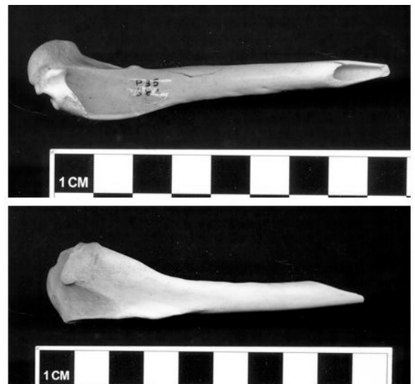
Fig. 2. Punzón en hueso de cormorán imperial ( P. atriceps ) de P 35 (Punta Entrada, Santa Cruz, Argentina).

el tamaño pequeño de la muestra arqueológica, también es acorde con la depositación natural. Además, dado que en los restos de otras aves se registró evidencia de procesamiento, la falta de modificaciones antrópicas en los huesos de cormoranes es otra variable que apunta al origen