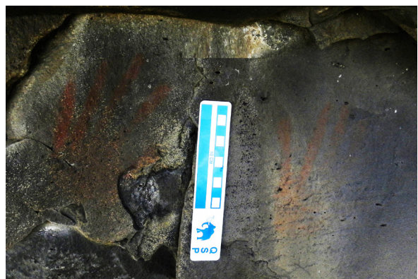
Fig.4. Positivos de manos en Potrero de las pinturas (C7)

En cuanto al tratamiento técnico, predominan los motivos lineales (n=56, 81%), de los cuales el 87% son rectilíneos (n=48). El resto de los motivos son estampados (excepto dos indiferenciados), correspondiendo todos ellos a positivos de manos. Cabe señalar que por tratamiento técnico nos referimos a los aspectos tecnológicos correspondientes a los procesos de manufactura; en el caso particular de las pinturas