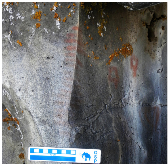
Fig.2. Serie de trazos paralelos usando como eje una arista del soporte (Potrero de las pinturas C1)

La C8 presenta asociados espacialmente cinco