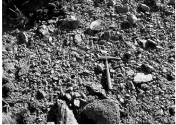
Fig. 9. Vista de la forma de presentación de materias primas en la Laguna 2 (La Gruta).

de un muestreo en cada uno de ellos (Fig. 8 y 9). En ambos sectores los muestreos se realizaron en la porción sur, correspondiendo los relevamientos de la Laguna 1 al interior de la misma, mientras que los de la Laguna 2 se hicieron en lomadas próximas a ella.