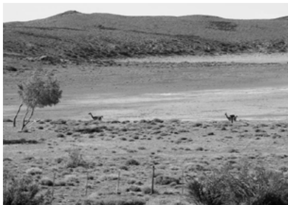
Fig. 6. Vista parcial de la Laguna 1 (La Gruta).

Se relevaron dos bajos lagunares separados por una distancia de ca. 1,2 km (Fig. 6 y 7), denominados Laguna 1 y 2 (cf. Franco y Cattáneo MS; Franco et al. 2010b), tomándose la información