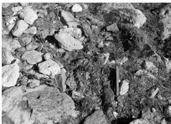
Fig. 4. Detalle de la forma de presentación de rocas en un sector del cañadón del Río Seco (Viuda Quenzana).