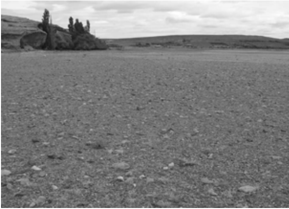
Fig. 8. Vista de la forma de presentación de materias primas en la Laguna 1 (La Gruta).