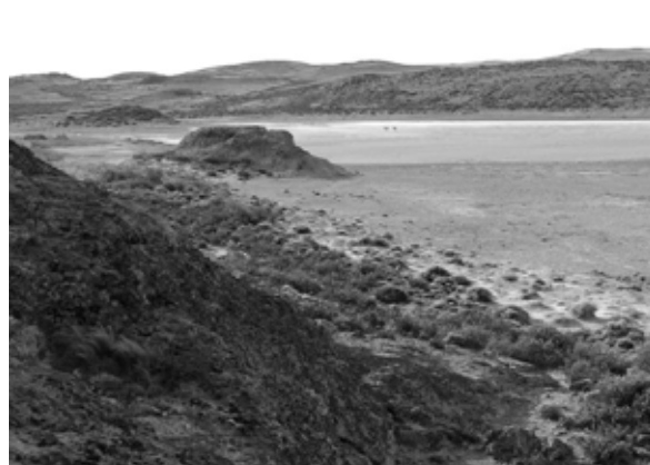
Fig. 7. Vista parcial de la Laguna 2 (La Gruta).