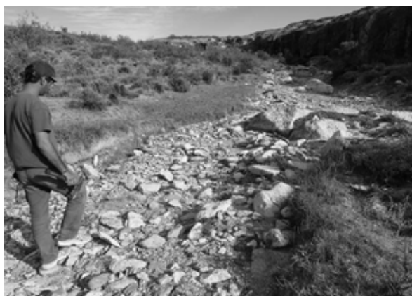
Fig. 2. Vista del cañadón del Río Seco (Viuda Quenzana).