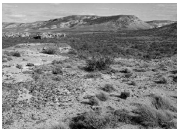
Fig. 3. Vista del sector de La Barda (Viuda Quenzana).