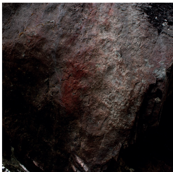
Fig. 3 Pigmento rojo cubriendo una amplia extensión de la roca, en un sector del alero Martín González Calderón. El tamaño de roca en la fotografía es de aproximadamente dos metros por dos metros.