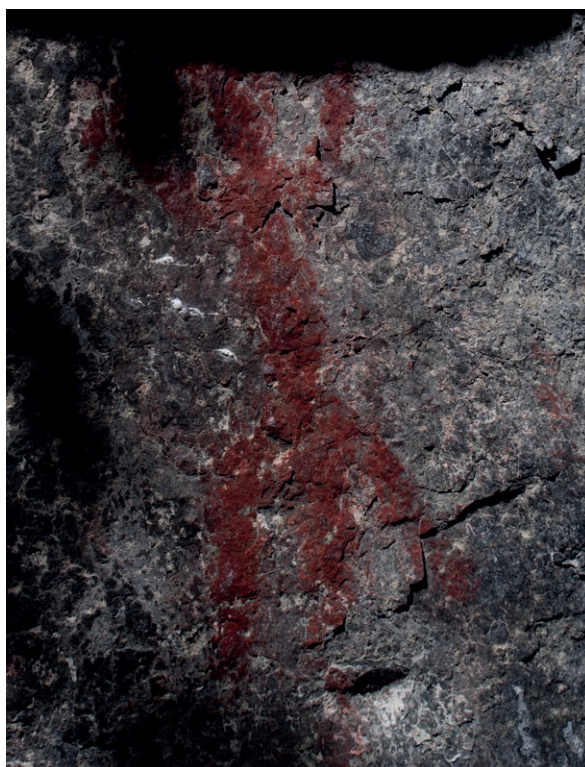
Fig. 4 Antropomorfo en pigmento rojo. Aproximadamente 30 centímetros de altura (las grandes manchas negras que se aprecian, corresponden a sombras sobre la fotografía).