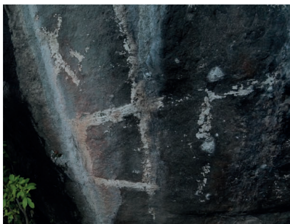
Fig. 2 Figuras y líneas trazadas con pigmento blanco sobre la pared de roca. El grosor de las líneas es casi del ancho de una mano. La línea vertical central es de aproximadamente un metro y medio de altura, misma longitud aproximada de la línea horizontal blanca en el centro del cuadro.

A pesar de la consideración respecto a que su estado de conservación es malo, se pueden plantear algunas conjeturas iniciales en relación a la situación en que se encuentran estas pinturas. Los análisis y dataciones realizadas a residuos de pintura encontrados en sitios